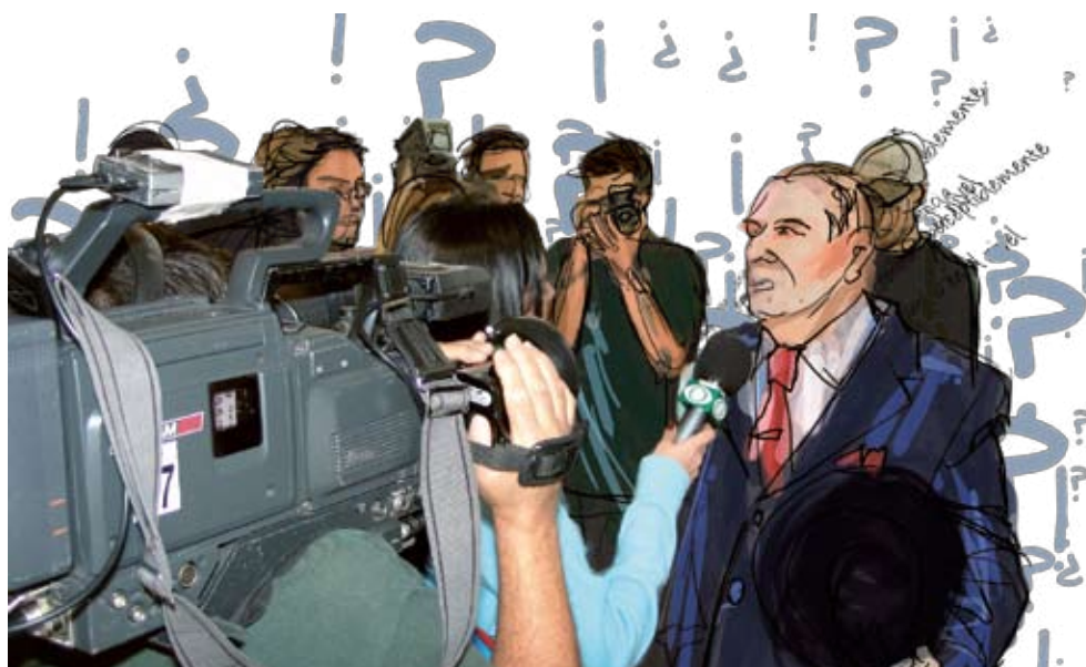
Figura 2. Aunque los noticieros y los periódicos utilizan predominantemente la función referencial, ¿podrías identificar alguna otra función en sus discursos?

Para que el proceso de comunicación entre las personas, que es constante, sea eficaz, es necesario que el emisor de texto o enunciador sea capaz de emplear un lenguaje comprensible por el enunciatario o receptor. Esto es válido en todos los ámbitos de la vida, desde el nivel de nuestras relaciones familiares e interpersonales hasta el que corresponde a las relaciones entre los diferentes países y culturas.