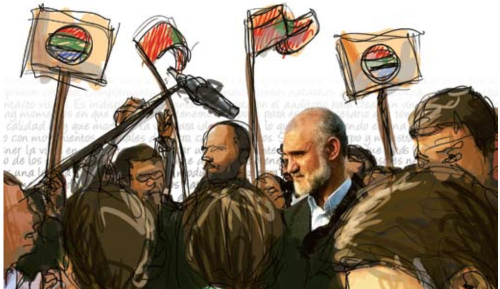
Figura 3. Los discursos de políticos utilizan principalmente la función apelativa, ya que tratan de convencer a sus oyentes de votar a su favor o de apoyar sus propuestas.

Roman Jakobson. Nació en 1896 y murió en Rusia. Este filólogo, desde que tenía 14 años participó en la creación del Círculo Lingüístico de Moscú y de la Sociedad para el Estudio del Lenguaje Poético de Leníngrado, los dos principales centros de difusión del movimiento posteriormente llamado “formalismo ruso”. En su libro Closing statements: Linguistics and Poetics (1958) definió las seis funciones del lenguaje: referencial, emotiva, conativa, fática, metalingüística y poética.