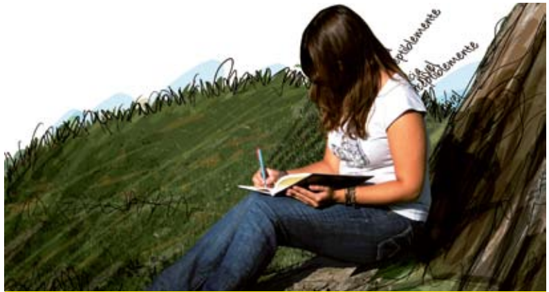
Figura 1. Cada enunciadore tiene intenciones distintas cuando escribe un texto. Imagina cuál podría ser el propósito del texto de quien aparece en la imagen.

En cambio, cuando el emisor limita su punto de vista, y su participación en el proceso comunicativo es para enfatizar la información relacionada con un problema y/o para lograr que el enunciadore intervenga en la solución, la categoría del texto es funcional; en otras palabras, la intención del emisor es referirse al contexto y lograr una respuesta activa en el receptor. La función de la lengua predominante es tanto la referencial, como la apelativa.